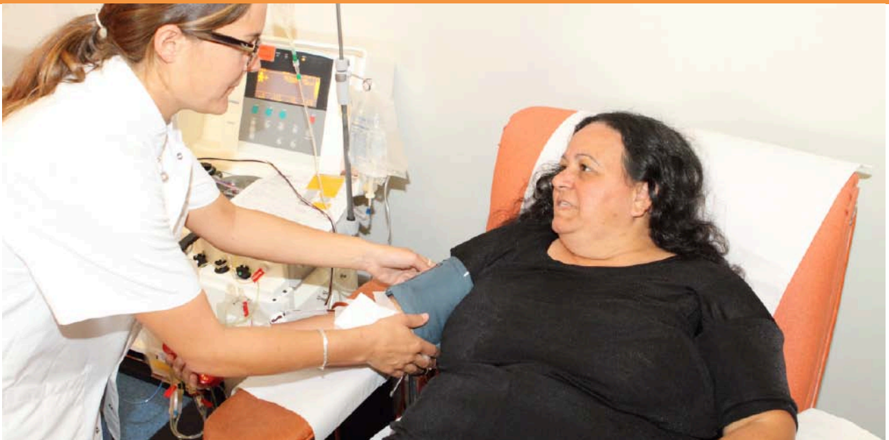
En 2011, l'EFS la Réunion a recueilli 26 734 dons